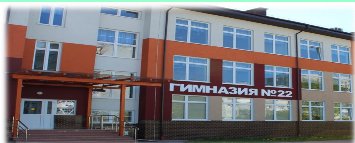
ул. Солнечный бульвар дом 5 Отделение начальной школы

дошкольное начальное общее основное общее свыше 1700 обучающихся и воспитанников