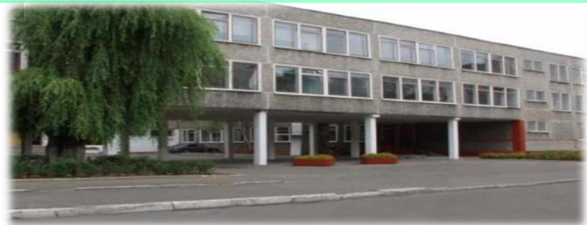
ул. Новый вал дом 23 Отделение старшей и средней школы